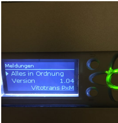
Alles in Ordnung.