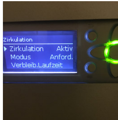
Pumpe läuft wieder.

Einige Tage später zeigt sich das gleiche Problem. Vorgang wiederholt, die Pumpe läuft einige Tage problemlos, dann wieder das gleiche Problem, Display blinkt rot. Was ist zu tun?