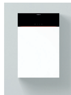
Vitodens 200-W Typen B2HF/B2KF

Komfortable Bedienung auf Augenhöhe durch nach oben versetzbares Display