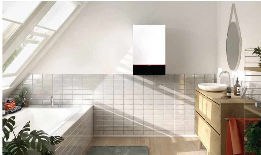
Vitodens 200-W mit attraktivem Design in der Farbe Vitopearlwhite

Vitodens 200-W ist das ideale Gas-Brennwert-Wandgerät für die Eigentumswohnung oder das Einfamilienwohnhaus. Es lässt sich problemlos in einer Nische im Badezimmer oder in einem Küchenschrank montieren. Vitodens 200-W ist mit einem Inox-Radial-Wärmetauscher aus hochwertigem Edelstahl ausgerüstet. Er garantiert Zuverlässigkeit und eine dauerhaft hohe Brennwertnutzung. Das gilt auch für den Matrix-Plus-Brenner.